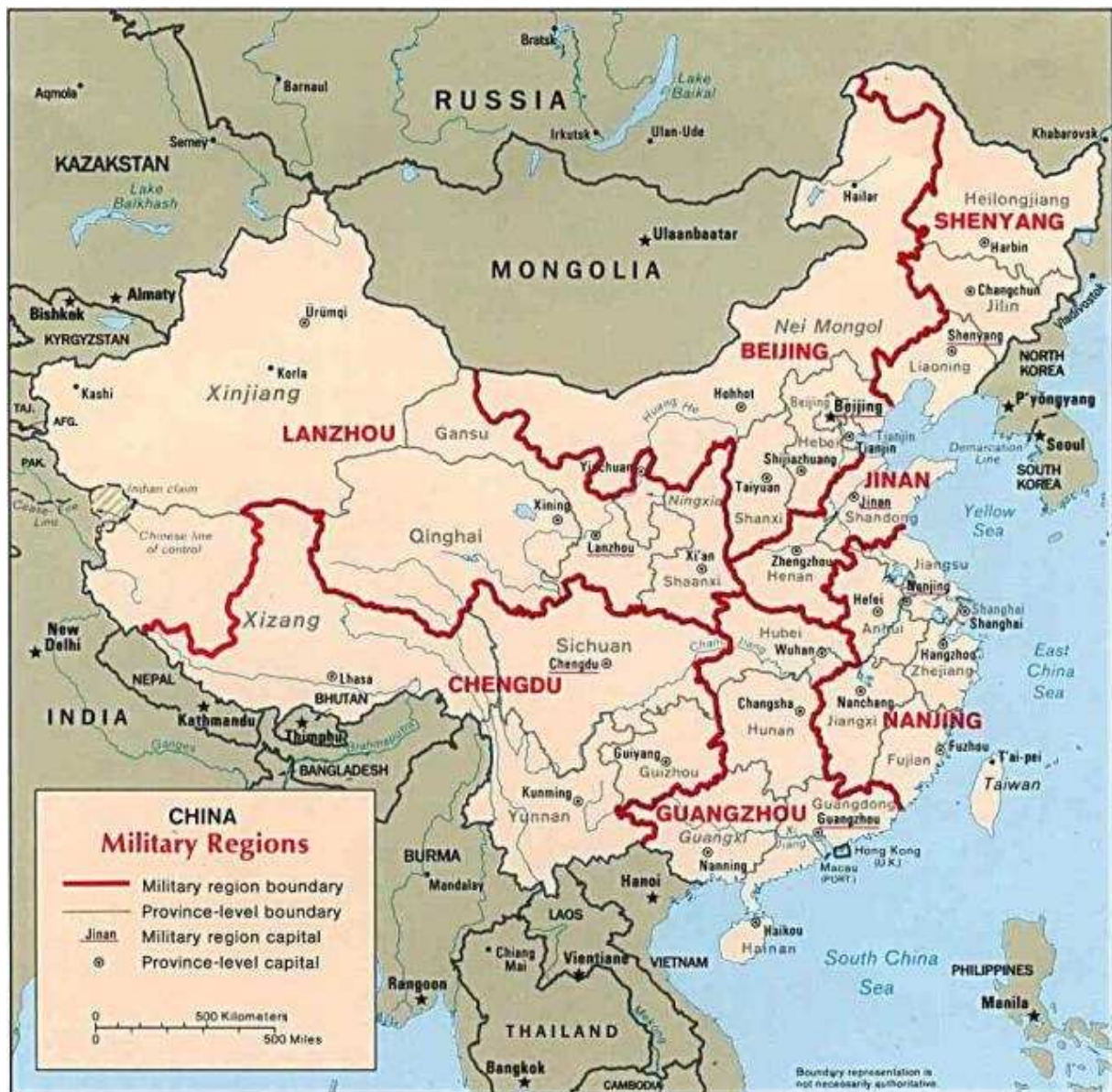
Carte des régions militaires chinoises.